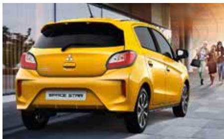
Abbildung zeigt Ausstattung Space Star Intro Edition+ 1.2 Benziner 59 kW (80 PS) 5-Gang 1 .

Space Star Intro Editon+: optional auch mit CVT-Automatik lieferbar.