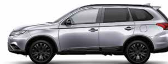
Abb. zeigt Ausstattung Outlander Spirit+ 2.0 Benziner 110 kW (150 PS) CVT 2WD 1

DER MITSUBISHI OUTLANDER SPIRIT ALS 2.0 BENZINER