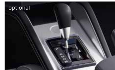
Abbildung zeigt Ausstattung ASX Spirit+ 2.0 Benziner 110 kW (150 PS) 5-Gang 4 .

ASX Spirit+: optional auch mit CVT-Automatik bzw. CVT-Automatik und Allrad lieferbar.