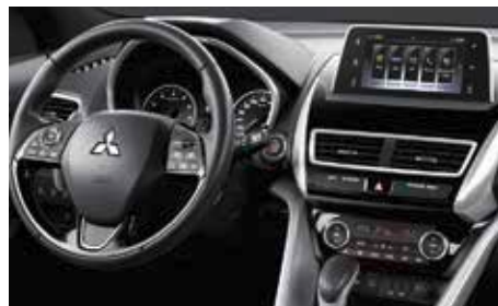
Abbildung zeigt Ausstattung Eclipse Cross Spirit+ 1.5 Turbo-Benziner 120 kW (163 PS) 6-Gang 1 .

Eclipse Cross Spirit+: optional auch mit CVT-Automatik bzw. CVT-Automatik und Allrad lieferbar.